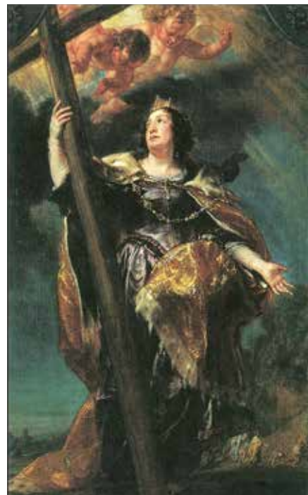
Die Hl. Helena von Jan Boeckhorst